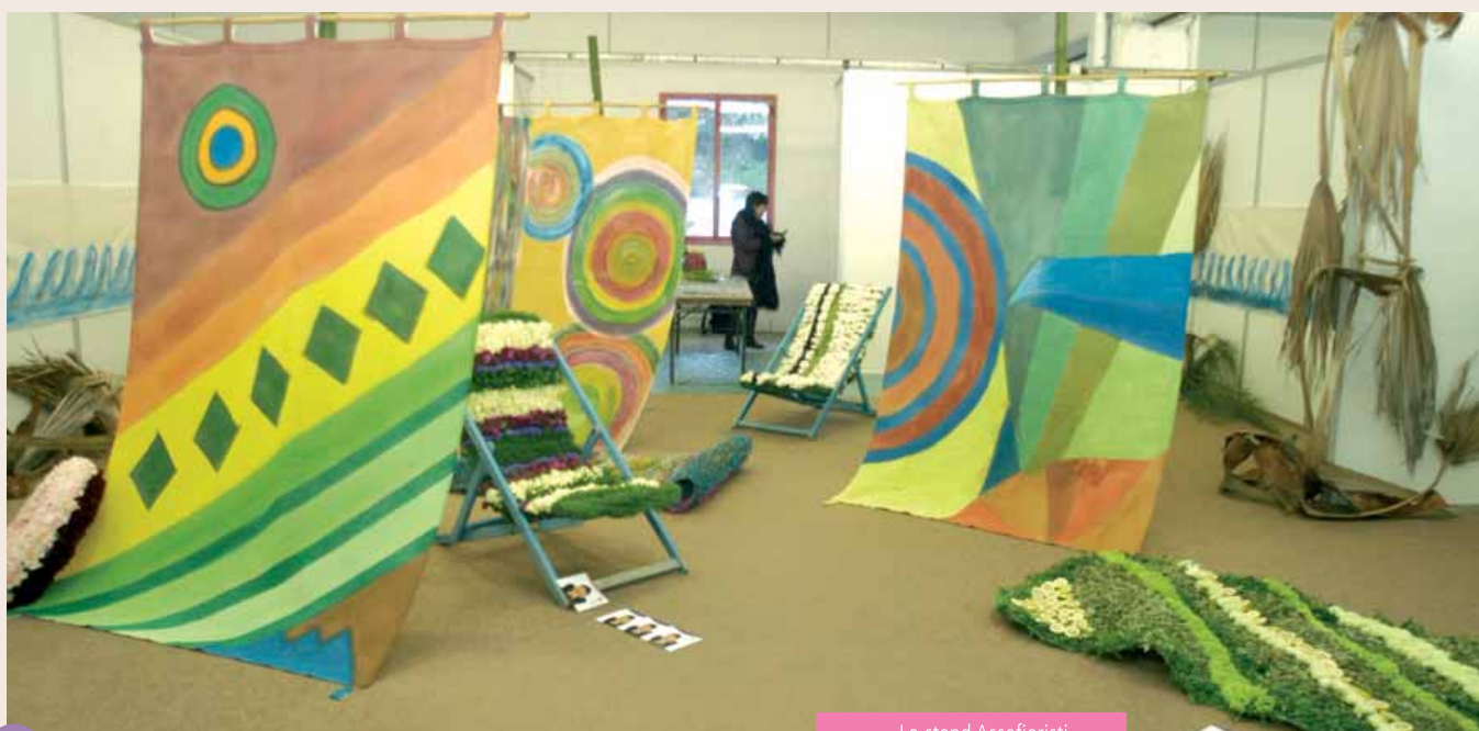
Lo stand Assofioristi