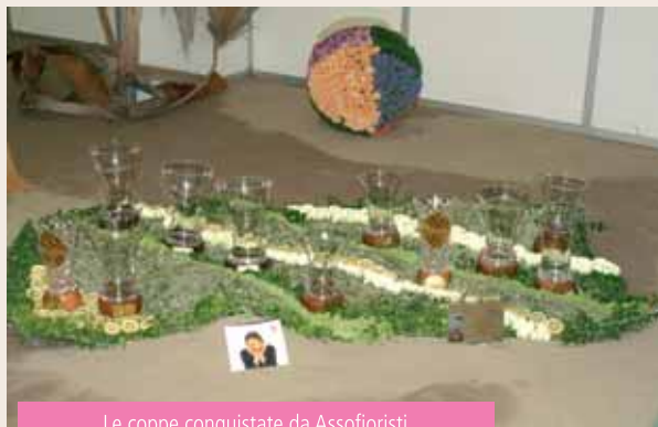
Le coppe conquistate da Assofioristi

Il mese scorso ho vissuto un'esperienza indimenticabile, iniziata con un viaggio incredibile... sono stato letteralmente travolto da una tempesta di neve e ho raggiunto la meta – Sanremo – con oltre cinque ore di ritardo dalla normale tabella di marcia.